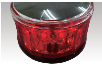
光源にLEDを採用しており長寿命です。