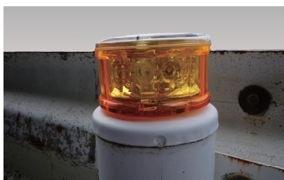
磁性構造物への設置が可能です。