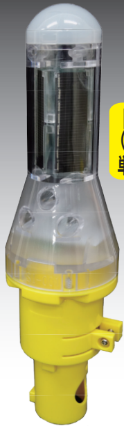
KSI-001 (カラーコーン、 単管取付タイプ)