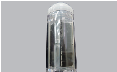
4枚のソーラーパネルを垂直に設置する事で、冬季の発電量の低下を防ぎます。