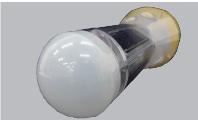
天面を球型にする事で、積雪の付着を最小限に抑えます。