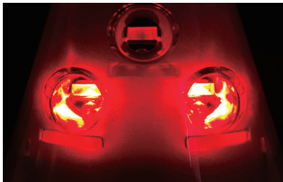
高輝度 LED とレンズの効果で明るく大きく光ります。