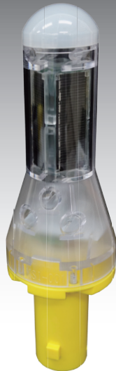
KSI-001C (カットコーン取付 タイプ)