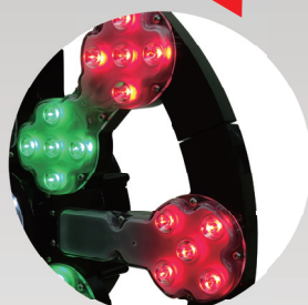
吹き抜け穴を設けました