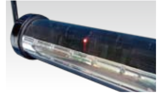
電源のON-OFFランプ付き。