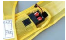
ベストの内側に電池ケースがあります。