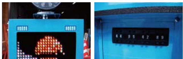
青LEDで視認性の高いプリンカー。