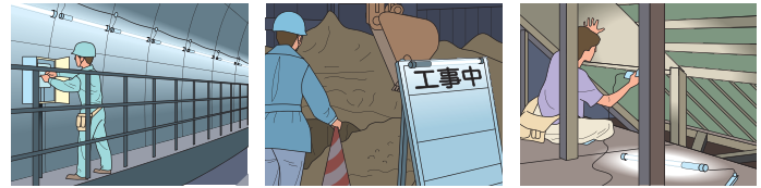
トンネル・地下道などでの使用。 工事現場での使用。 機材が持ち込めない所での使用。