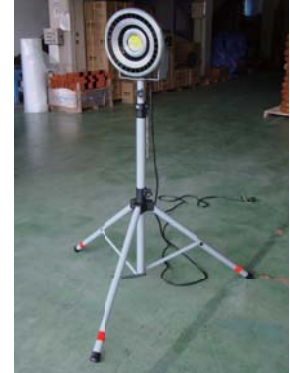
オプションの三脚ブラケット使用