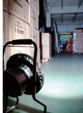
効率よく広範囲を照らせます。