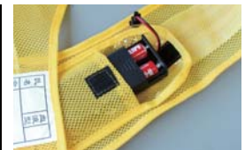
ベストの内側に電池ケースがあります。