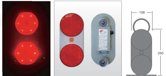
RK-3R(M)マグネットタイプ