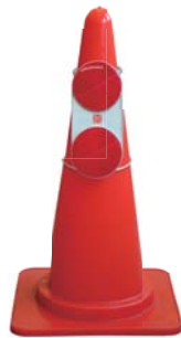
カラーコーン使用例