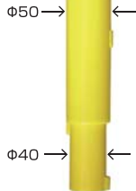
AKC-D (カットコーン φ40、φ50兼用)