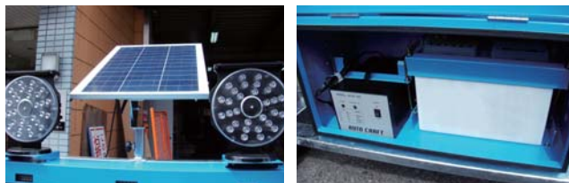
50Wのソーラーパネル使用。無日照約12日間。充電器付きなので、100Vで強制充電可能。