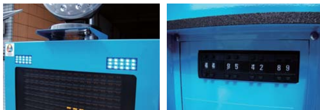
青LEDで視認性の高いプリンカー。