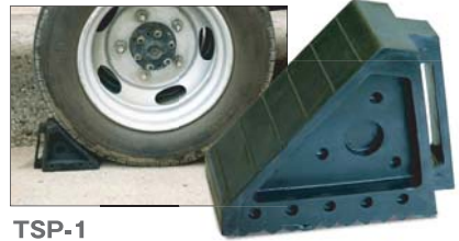
TSP-1 ●サイズ/W100×H150×D200 ※2トン車クラスまで対応。