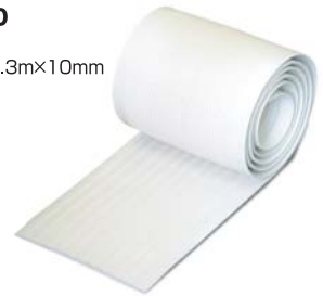
TSL-2300 ●サイズ/ 190mm×2.3m×10mm