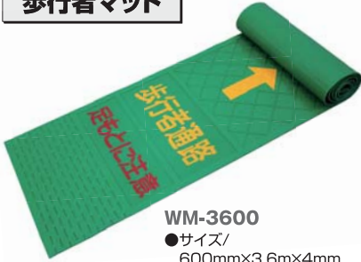
WM-3600 ●サイズ/ 600mm×3.6m×4mm