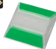
SB-GW ●両面同色反射 緑+緑