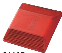
911AR ●両面同色反射 赤+赤