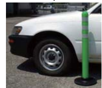
【踏み潰し後】 車輪で踏み潰してもすぐ復元