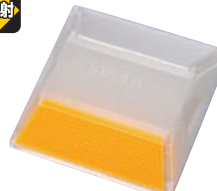
SB-Y ●片面反射 黄