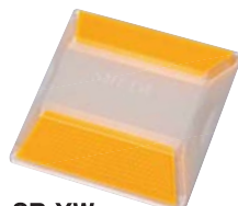
SB-YW ●両面同色反射 黄+黄