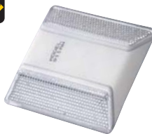
911AW ●両面同色反射 白+白