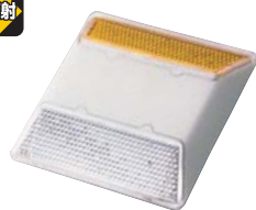
911EYW ●両面異色反射 黄+白