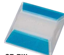
SB-BW ●両面同色反射 青+青